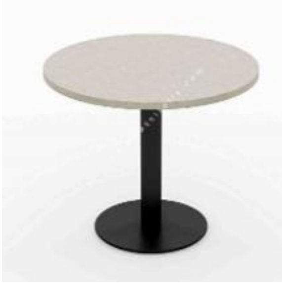
Tabla 18 mm E1 Kalite MDF Lam olacaktır. Tabla beyaz renkli olacaktır. Ayak Flanşı \varnothing 400*6 mm DKP metalden imal edilmiş olup, yüzeyi fosfat yıkama sonrası 220° elektrostatik toz boya ile fırınlanacak. Sehpanın ayak kısmının rengi gri olacaktır. Boru Profil ölçüsü \varnothing 60*2 mm DKP metalden imal edilmiş olup, yüzeyi fosfat yıkama sonrası 220° elektrostatik toz boya ile fırınlanacak. Genişlik ve Derinlik 0,50mm / Yükseklik 43cm