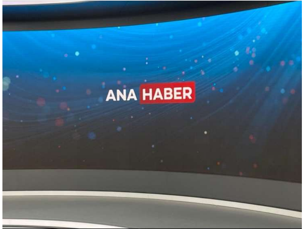
Şekil 5. Led ekran. TRT Haber Stüdyosu (Tekşen, 2021)

Fonda kesintisiz, bütün olarak devam eden led ekran sabit ve hareketli görüntülere olanak sağlamaktadır. Burada grafiklerin tasarımı da setin kendisi kadar önem taşımaktadır.