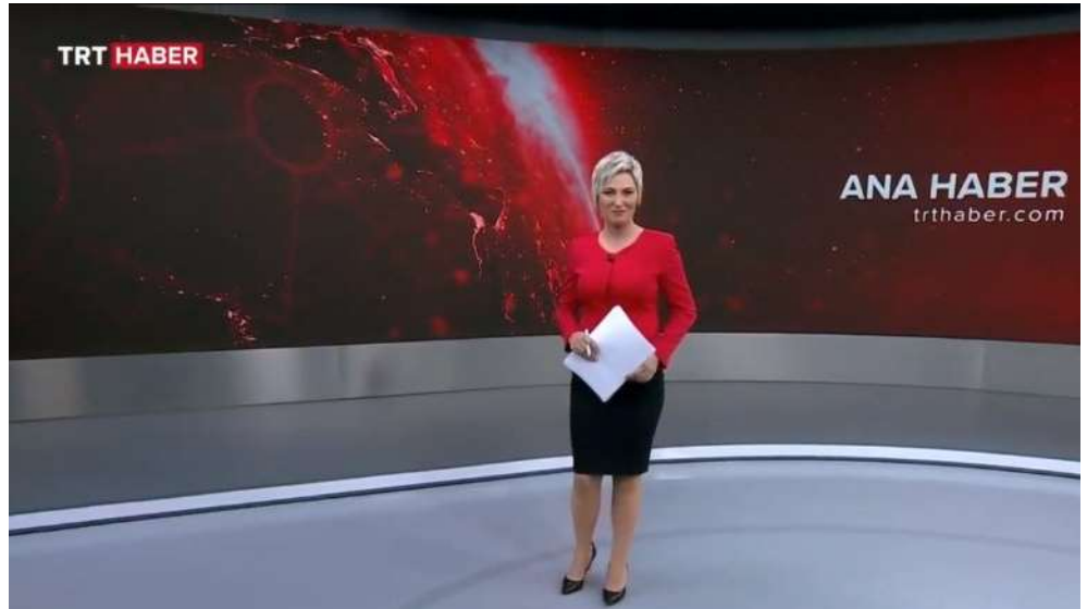
Şekil 8. Led ekran ve tekli kelebek görüntüsü. TRT Haber Stüdyosu (Tekşen, 2021).

İzleyicinin dikkatini dağıtabilecek hiçbir unsur dekorda yer almamaktadır. Programın dinamik bir parçası olarak led ekran rol oynamaktadır. Haber bültenlerinde ve programlarında en çok kullanılan program ismi ya da harita gibi unsurlar sabit grafiklerdir. Tekrar eden hareketli görüntüler olduğu gibi, içeriğe göre kullanılan grafikler de vardır. Hazırlanan grafiklerin içinde canlı bağlantı görüntüleri için yapılan alana “kelebek” denilir.