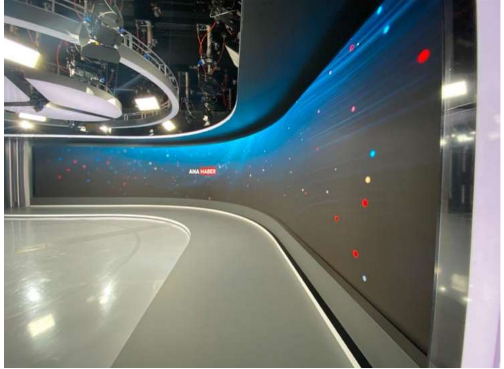
Şekil 7. Genel Görünüm. TRT Haber Stüdyosu (Tekşen, 2021)

Zeminde iki tonda mat gri kullanımı nötr renklerle geri planda bırakılmak istendiğini göstermektedir. Farklı tonlar, zeminin ekranda \frac{1}{3} oranda görünmesi sebebiyle monotonluğun engellemesi için kullanılmıştır.