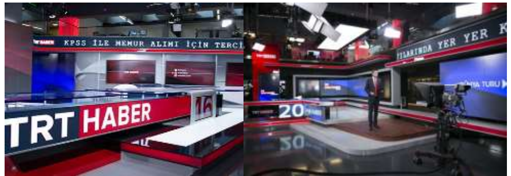
Şekil 3-4. TRT Haber Stüdyosu 2013

Günümüzde adı 15 Temmuz Stüdyosu olan haber stüdyosunun 2013 yılında set tasarımı 6 farklı sabit setten oluşmaktaydı (Şekil 3-4). Bu dekorlarda, 24 saat boyunca haber bültenleri, sabah haberleri, ana haber bültenleri, ekonomi haberleri, hava durumu gibi farklı zaman dilimlerinde yayın yapılmaktaydı. İki kat yüksekliğinde galeri boşluğundaki stüdyonun üst katında açık ofisler bulunmaktaydı. Fonda led ekranların kullanılması farklı grafiklerle farklı programların yapımına olanak tanımaktadır. Ancak led ekranları çerçeveleyen gri fon ve onun etrafındaki kırmızı ışık bandı oldukça karakteristik bir kimlik taşımaktadır. Masa ve altındaki platform da hem geometri, hem malzeme açısından dikkat çekmektedir. Yatay kayan yazılı led sistemi de sürekli hareket eden yazıları sayesinde ayrı bir ilgi odağı olmaktadır.