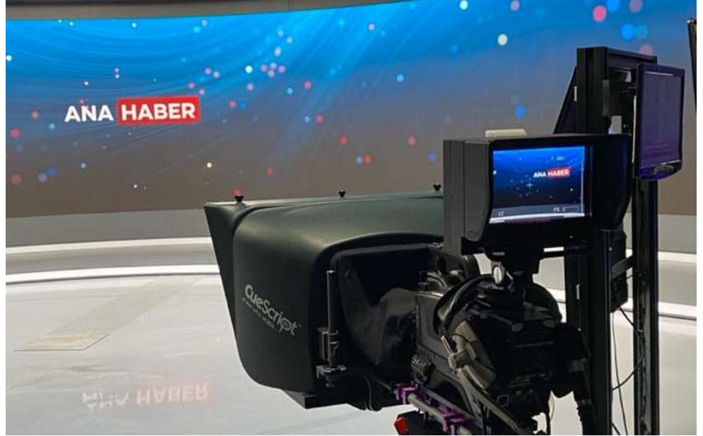
Şekil 1. Led ekran ve vizördeki görüntüsü. TRT Haber Stüdyosu (Tekşen, 2021)

Set tasarımı eğitiminde öncelikli kavramlardan biri “görüntü çerçevesi”dir. Sahnede nesnelerin konumlandırılması belirli prensiplerle yapılmalıdır. Doğru düzenlenen bir sahnede izleyici ilgisinin görüntü çerçevesi içinde olması hedeflenir.