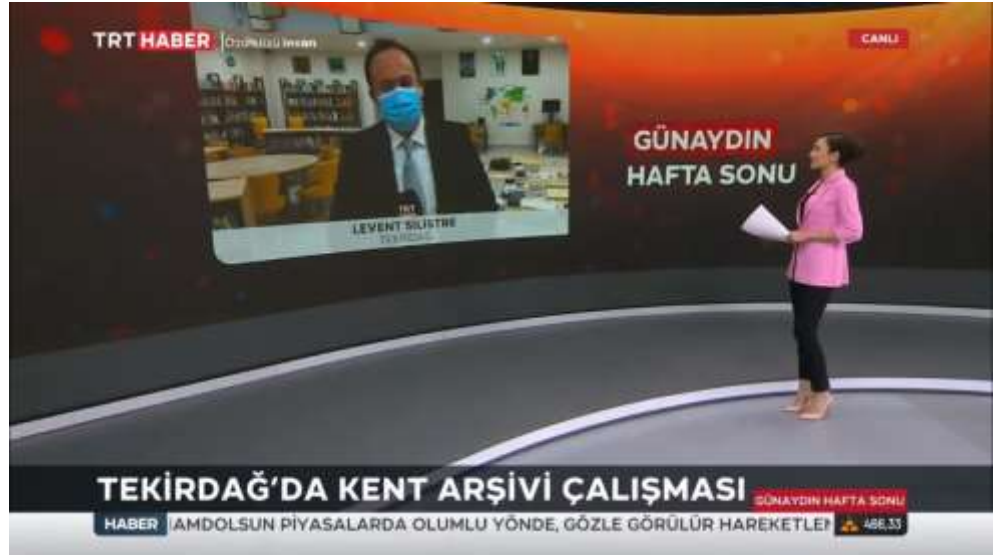
Şekil 9. Led ekran ve tekli kelebek görüntüsü. TRT Haber Stüdyosu (Tekşen, 2021).

Bütün led ekranın içinde kaç tane kelebek kullanılacağı her bir haber için farklılaşabilir. Aynı ayrı parçalı ekranlar yerleştirip dekor parçalarıyla bölüntüler oluşturmak yerine bütüncül bir anlayışla tek ve büyük ekran kullanılmıştır. Sabit görüntülü fonlardan, canlı muhabir bağlantılarına kadar farklılık gösteren fonksiyonlar tek bir düzlemde çözülmüştür.