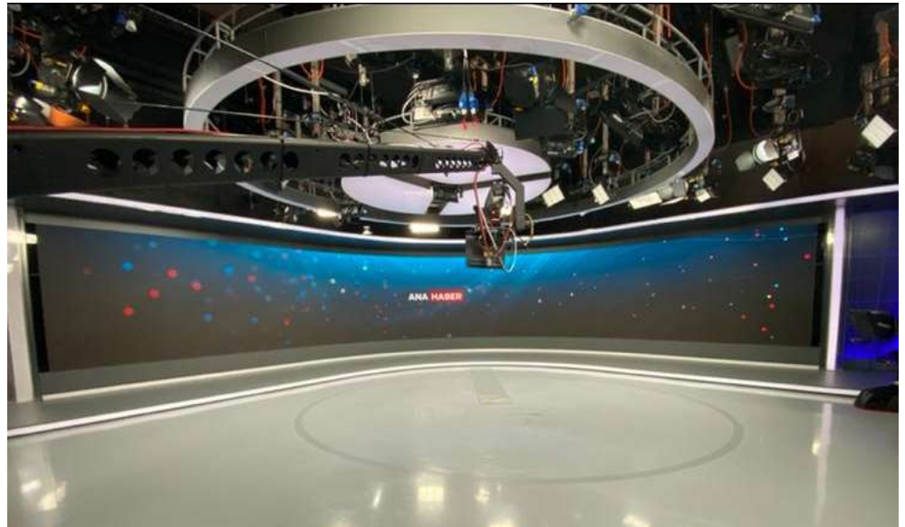
Şekil 6.. Genel Görünüm. TRT Haber Stüdyosu (Tekşen, 2021)